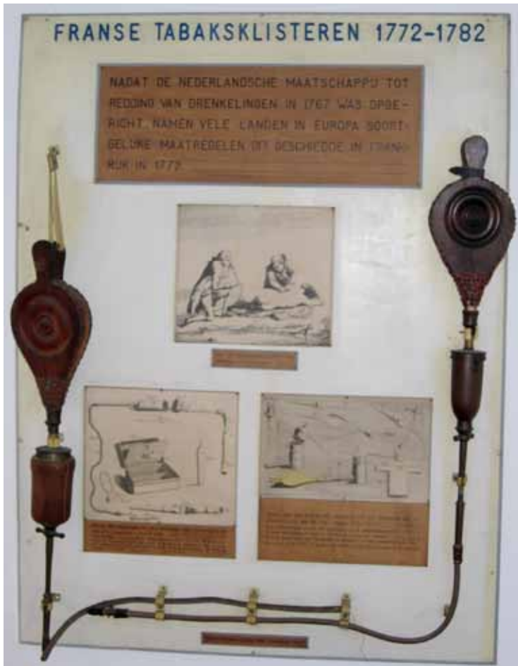
In het museum Dorus Rijkers wordt aandacht geschonken aan redden die door de Maatschappij werden bekroond.